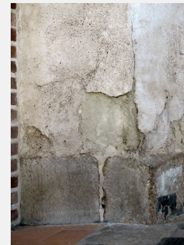
état de l'enduit actuel de la sacristie